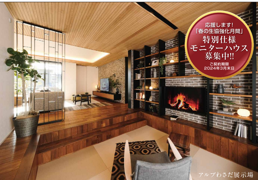
アルプわさだ展示場

応援します! 「春の生協強化月間」 特別仕様 モニターハウス 募集中!! ご契約期限 2024年3月末日