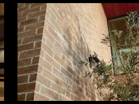
せじ器質無釉タイル タイルの表面に加工のプロセスであえて傷をつけ、手間限を惜しまずエイジング感を表現。味のある陰影が趣き深い、アンティーク感のあるタイルです。