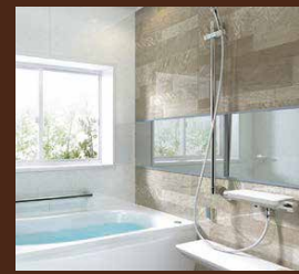
グレードアップ仕様の浴室 (トクラス・LIXIL・TOTO・積水ホームテクノ)