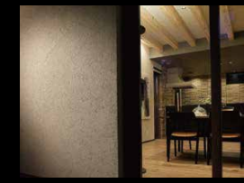
土壁風の外壁吹付SODO 自然素材「藁すさ」の風合いと「あたらしい日本の色」が特徴の断熱外壁塗材。落ち着いた和の質感で、高い耐久性とデザイン性で外観を美しく保ちます。