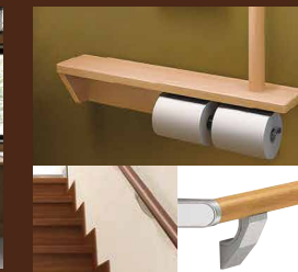
各所に安心の手摺り