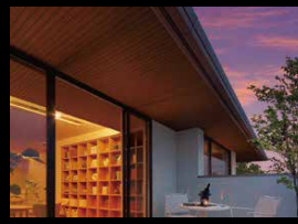
趣深い木調軒天 日差しをさえぎり、外と内の中間領域を生む深い軒。軒先を木調にすることで意匠性を高め、あたたかな質感と風格ある佇まいを演出します。