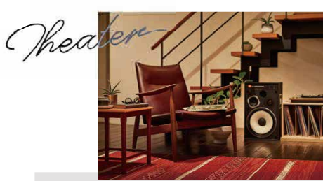
おうちでシアター 映画や音楽を気兼ねなく楽しめるホームシアタースペース。夜はおしゃれなバーカウンターにも。