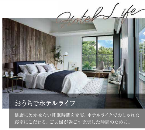
おうちでホテルライフ 健康に欠かせない睡眠時間を充実。ホテルライクでおしゃれな寝室にこだわる。ご夫婦が過ごす充実した時間のために。