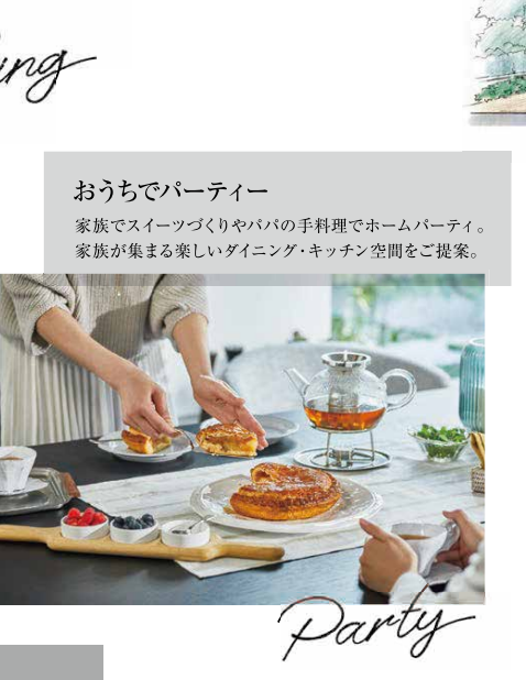
おうちでパーティー 家族でスイーツ作りやパパの手料理でホームパーティ。家族が集まる楽しいダイニング・キッチン空間をご提案。