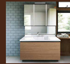
こだわりの洗面化粧台 (住友林業クレスト・LIXIL・TOTO)