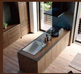
新素材を採用したキッチン (トクラス・LIXIL・クリナップ)