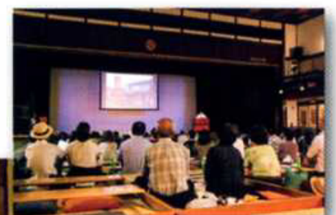
《前回の見学会の風景》