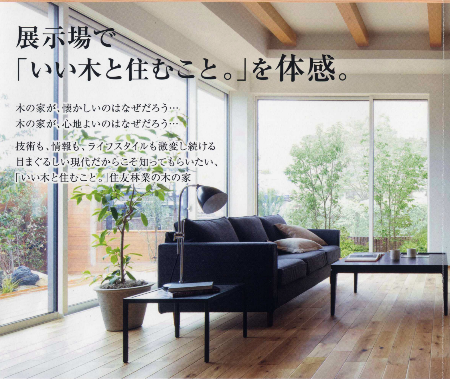
木の香りで 快眠を体感

木の家が、懐かしいのはなぜだろう… 木の家が、心地よいのはなぜだろう… 技術も、情報も、ライフスタイルも激変し続ける 目まぐるしい現代だからこそ知ってもらいたい、 「いい木と住むこと。」住友林業の木の家