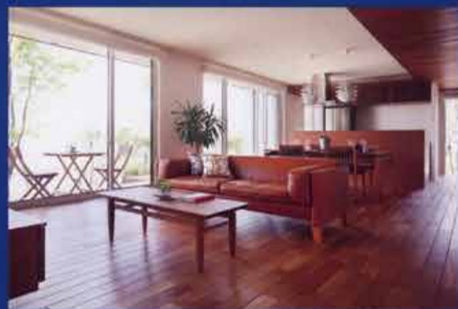
※写真はイメージです。今回の見学会会場とは異なります。

詳しい会場のご案内を差し上げます。ご予約・お問い合わせはお気軽にフリーダイヤル0120-383-699へ ※ご入居者様の都合上、前日までのご予約をお願いいたします。