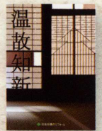
旧家リフォーム実例集