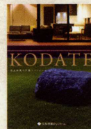
戸建リフォーム実例集