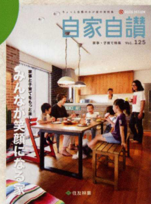
vol.125 「家事・子育て特集」