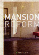
マンションリフォーム実例集