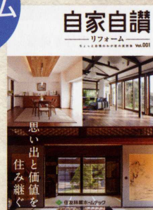
リフォーム実例集