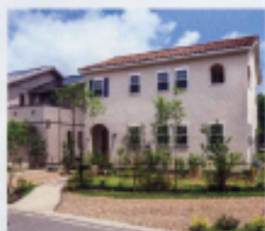
白い上げ下げ窓と塗り壁、オレンジの瓦屋根で つくったプロヴァンス風の外観。