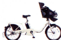
電動アシスト自転車