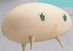
住友林業の シンボルキャラクター 「きこりん」